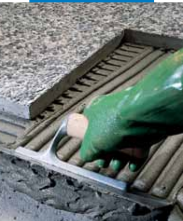
Εξωτερική εφαρμογή πλακών μωσαϊκού "graniglie"