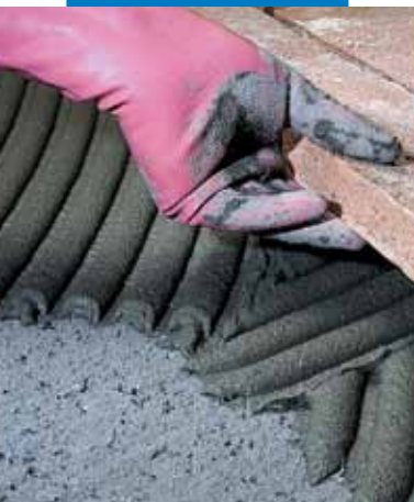
Εφαρμογή χειροποίητων πλακιδίων terracotta σε ανώμαλη επιφάνεια