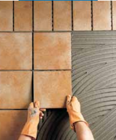
Εξωτερική εφαρμογή πλακιδίων klinker